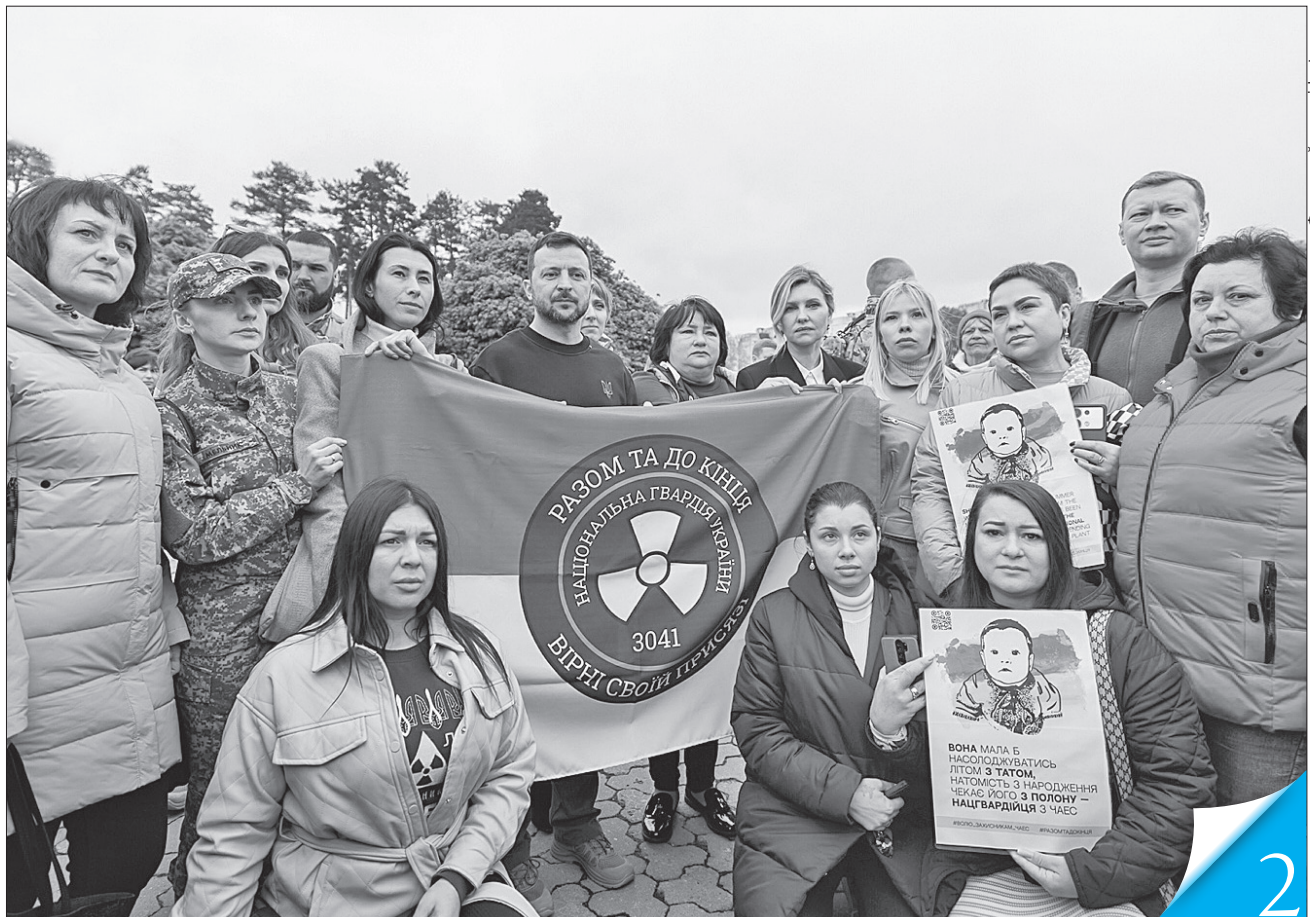
Володимир Зеленський поспілкувався з рідними полонених на ЧАЕС нацгвардійців, які звернулися до глави держави із проханням повернути захисників додому

ПИЛЬНІСТЬ НА ЧАСІ. Під час робочої поїздки у Славутич Президент провів нараду щодо безпекової ситуації та перспектив розвитку міста й зони відчуження