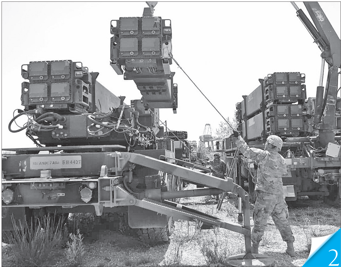
Рішення щодо додаткових систем Patriot та SAMP/T, ракет до них, артилерії й боєприпасів, іншої зброї та обладнання здатні запобігти гіршим сценаріям

МІЖНАРОДНІ ВІДНОСИНИ. Міністри закордонних справ та оборони України висловили вдячність європейським колегам за всю надану нам військову та іншу підтримку