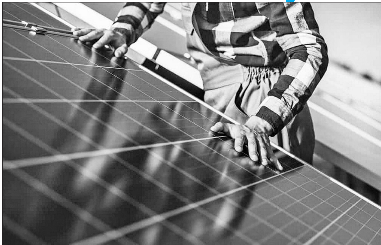
Урядовці двох країн обговорювали, зокрема, розбудову розподіленої генерації