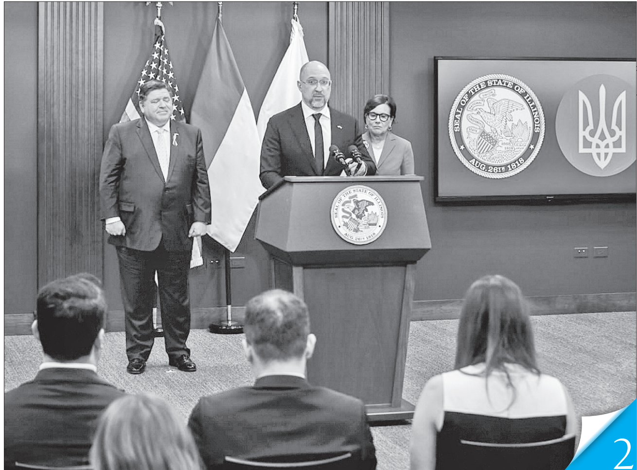
Денис Шмигаль подякував Джею Пріцкеру за підтримку та Пенні Пріцкер за залученість в українські справи

МІЖНАРОДНА ДІЯЛЬНІСТЬ. Україна потребує залучення американських інвестицій для відновлення й розвитку