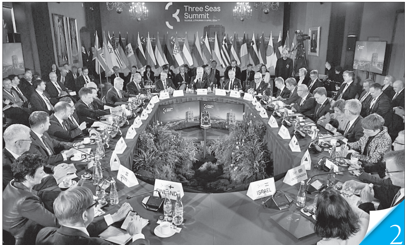
Учасники саміту ухвалили спільну декларацію, в якій висловили підтримку ідеї побачити стійкішу Європу

СОЮЗНИЦТВО. Президент України закликав учасників саміту Ініціативи трьох морів посилити протидію росії