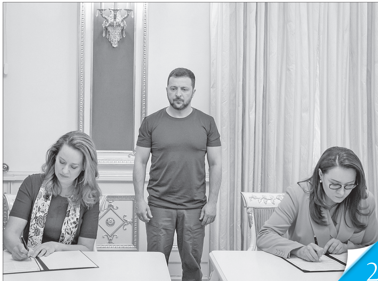
У присутності Президента України перший віцепрем'єр-міністр Юлія Свириденко та гендиректор МОМ Емі Поун підписали один із документів

УГОДИ. Мінекономіки та Міністерство закордонних справ співпрацюватимуть з Міжнародною організацією з міграції