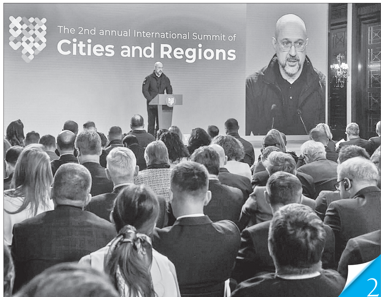
Прем'єр-міністр Денис Шмигаль повідомив, що за час від попереднього зібрання вже укладено понад 1600 партнерських угод