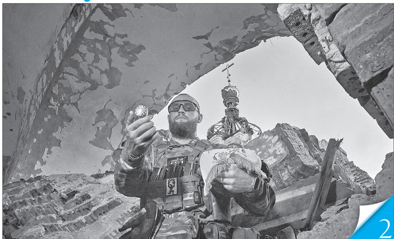
Сімейне тепло та обійми рідних — мрія кожного, хто стоїть на захисті близьких

ЖИТТЯ ПЕРЕМОЖЕ СМЕРТЬ. Привітання Президента України з Великоднем